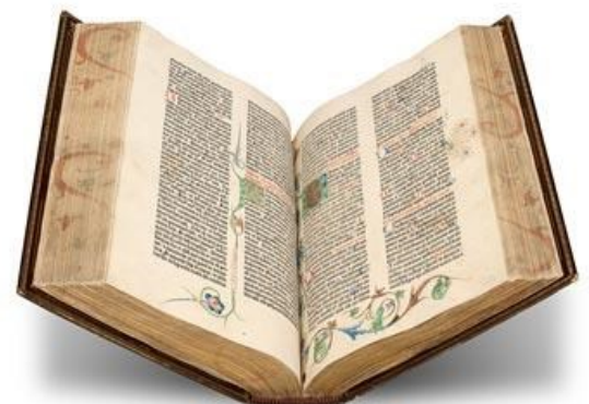
Bible de Gutenberg